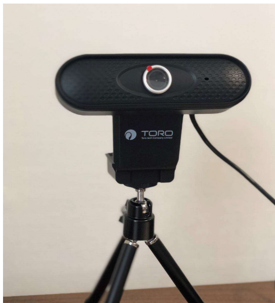
三脚固定時の製品状態

◇ 三脚は同梱されておりません。 三脚をご使用になる場合は別に市販品をご購入いただきご使用ください。 また、取り付け可能な三脚は、1/4-20UNC 外径1/4インチ(6.35mm)となります。